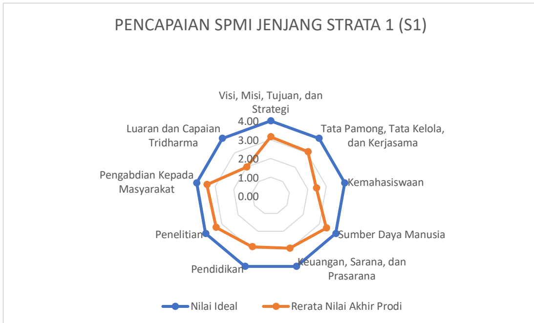
Gambar 1: Hasil Pencapaian SPMI Jenjang S1

Nilai capaian tertinggi standar (kriteria) dalam SPMI pada jenjang Sarjana (S1) adalah 3.45 yakni pengabdian kepada masyarakat. Sedangkan nilai capaian terendah standar (kriteria) dalam SPMI pada jenjang Sarjana (S1) adalah 2.00 yakni luaran dan capaian tridharma.